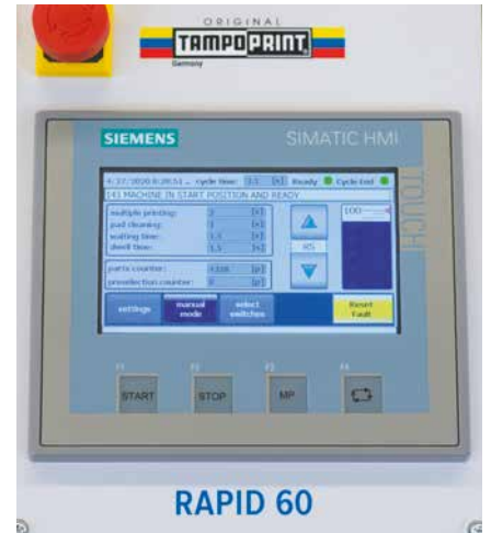
Funcionamiento moderno a través de un panel táctil fácil de usar

La serie RAPID está disponible con extensiones útiles, prácticas y adicionales para configu-