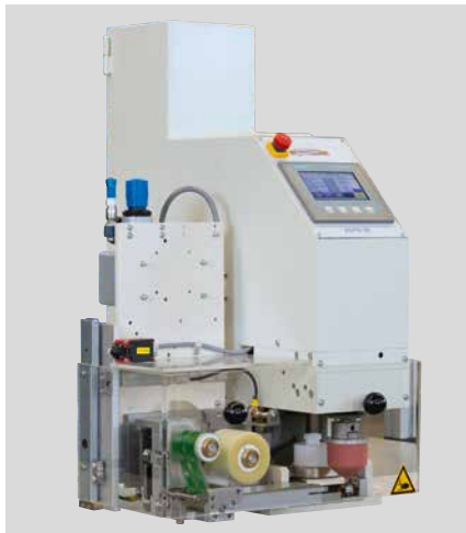
RAPID 60 modelo integrado con la opción del sistema limpiador de tampones

La serie RAPID se integra como una máquina incorporada en procesos de automatización completos en varios sectores industriales, como el del automóvil, juguetes, tecnología médica y muchos más. Se centran en las marcas y decoraciones de los productos, que se producen en grandes volúmenes y a altas velocidades de proceso.