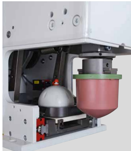
Área de impresión RAPID 90

La máquina impresiona por su alta velocidad y al mismo tiempo por su alta repetibilidad. Convince por su buen funcionamiento, que